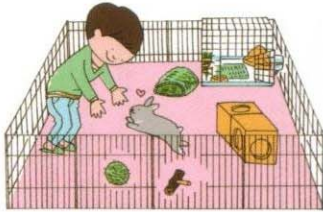
安全なスペース確保には、 ペットサークルが便利。